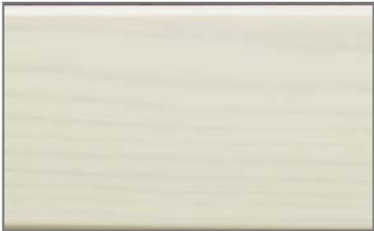
Weiß (RAL-lasiert) - 40 % auf Kiefer

Neben den bekannten Farbgebungen (RAL, Lasur, NCS, Natur) kann ab sofort auch die Farbgebung RAL-lasiert angeboten werden. Diese Farbgebung passt sich ideal der Farbgebung im Innenbereich des Objektes an (z. B. dem beliebten Farbton „Kalk“ bei Innentüren).