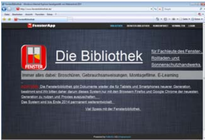
femoso jetzt auch über den Browser verfügbar

verfügbar. Damit können in Zukunft Prospekte, Broschüren und sonstige Dokumente der Fensterapp auch über jeden internetangebundenen Computer nach erfolgreicher REGISTRIERUNG eingesehen werden.