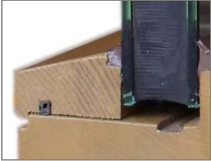
Überfälszte Glasleiste mit zusätzlicher Dichtlippe