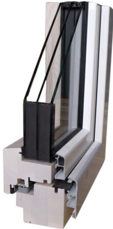
IV78 HA - Holz-Alu- Musterecke (unten) und Profilsicht (oben)