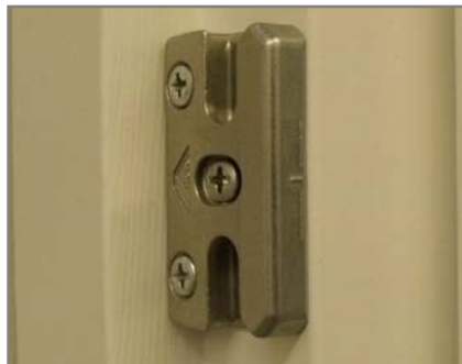
Metall-Schließteile im Blendrahmen (über die komplette Falztiefe)