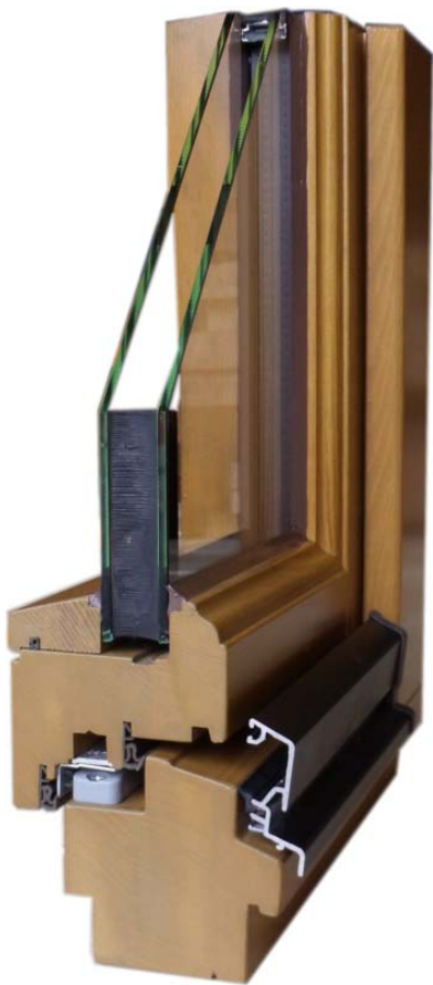
IV78 Musterecke (78/78)